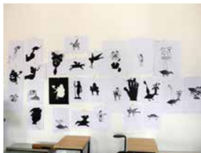
Desenvolvimento do Workshop de Artes Visuais - Monotipias