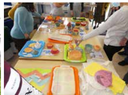
Desenvolvimento do Workshop presencial de Cerâmica (utilitária e artística)